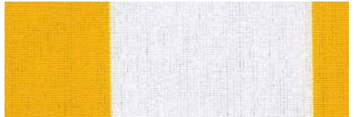
Stoff Nr. 10: sonnengelb, weiß gestreift