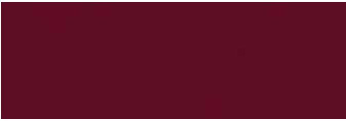
Stoff Nr. 01: dunkelrot uni