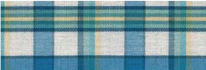
Stoff Nr. 04: bleu, ecru, hellgrün, hellgelb kariert