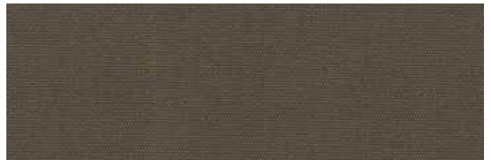
Stoff Nr. 21: taupe uni