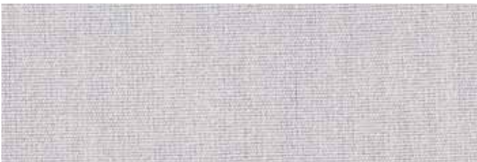
Stoff Nr. 06: weiß uni