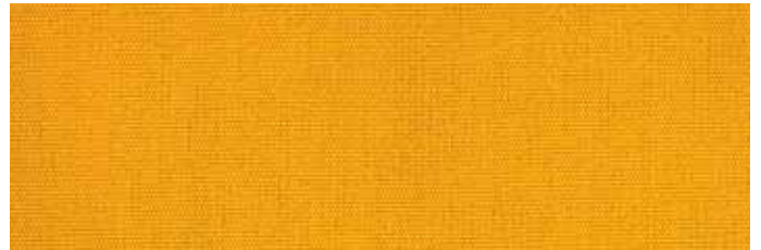
Stoff Nr. 09: sonnengelb uni