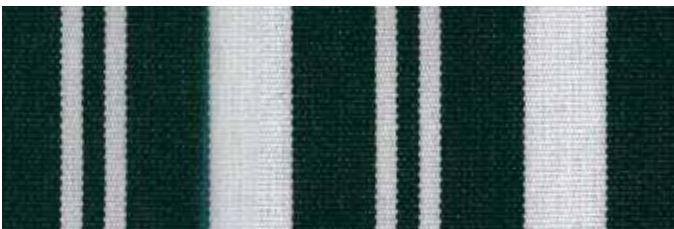
Stoff Nr. 07: dunkelgrün weiß gestreift