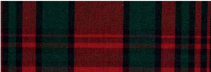
Stoff Nr. 05: dunkelrot/-blau/-grün kariert