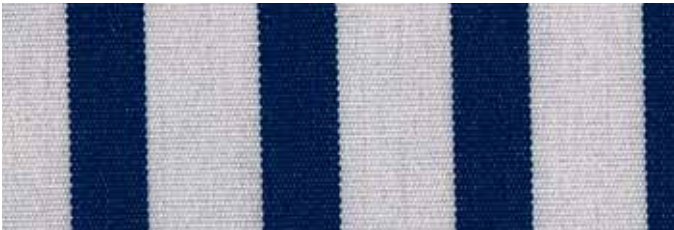
Stoff Nr. 03: dunkelblau/weiß gestreift