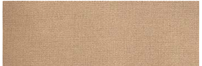
Stoff Nr. 11: beige uni